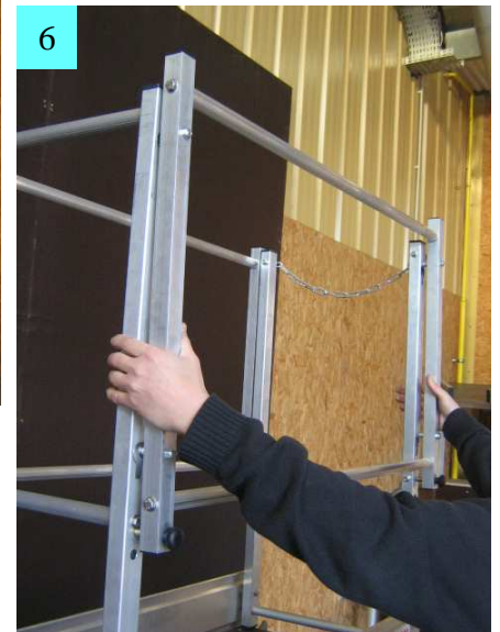
6. Assembler les garde corps longitudinaux en maintenant les gardes corps avant et arrière.