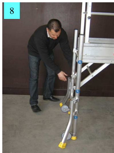
8. Positionner les stabilisateurs avec un angle d'environ 20° et serrer fermement.