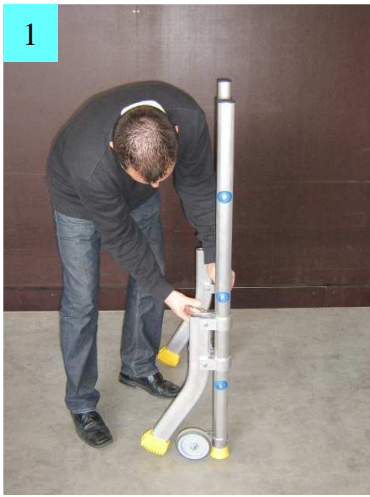
1. Positionner au sol grâce aux stabilisateurs l'échelle Minipli (échelle la plus large).