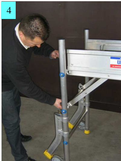
4. Positionner et fixer les équerres du plateau Minipli aux 2 échelles. L'échelle d'accès est légèrement penchée pour faciliter l'accès.