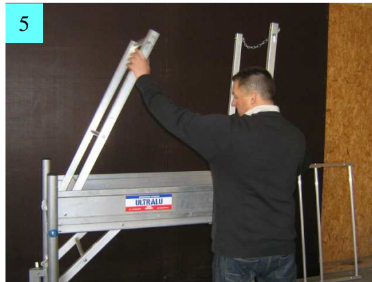
5. Monter les garde corps avant et arrière.