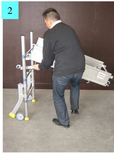
2. Assembler le plateau au dernier échelon de l'échelle Minipli. Côté du plateau crochet bascule vers l'extérieur.