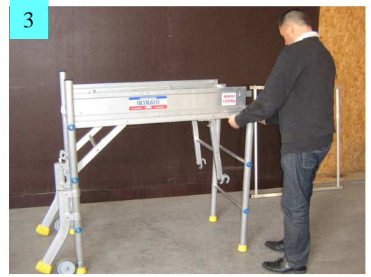
3. Assembler le plateau au dernier échelon de l'échelle d'accès. Côté du plateau crochet bascule vers l'intérieur.